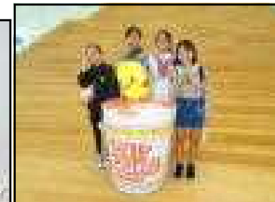
カップヌードルミュージアム