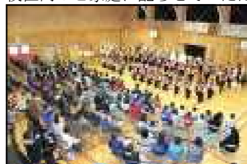
昨年度の音楽会の様子