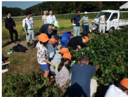
指導者の方が見守る中枝豆を収穫