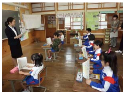
上手に音読をします。