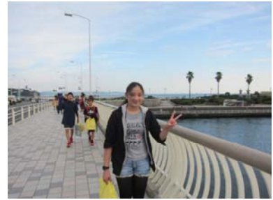
江ノ島海岸を歩きます。