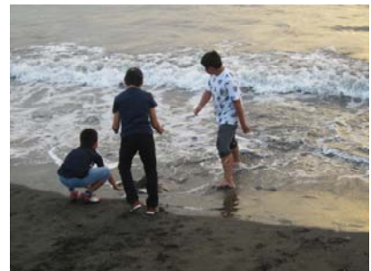
江ノ島の雄大さに感動！