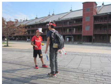
赤レンガ倉庫から赤いくつのバスに乗りました