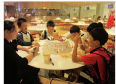
カップヌードルミュージアム