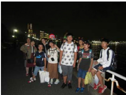
横浜の美しい夜景