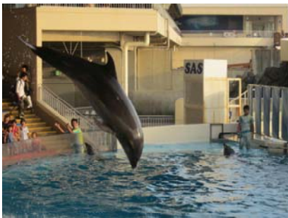
新江ノ島水族館のイルカのジャンプ！