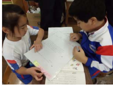
互いに学び合います。