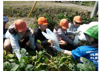
「こんなに採れたよ！」