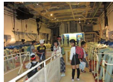
2016年重要文化指定 「氷川丸」乗船