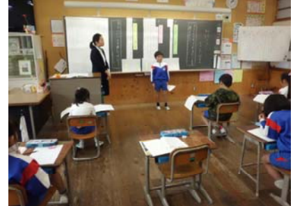
みんなで話し合います。