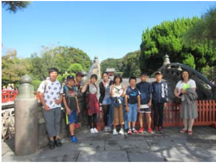
鶴岡八幡宮に到着