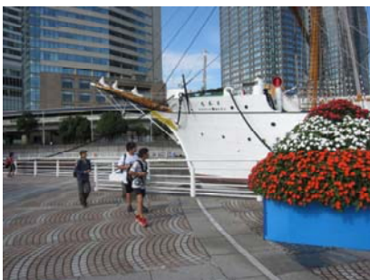
馬車道通りにある帆船