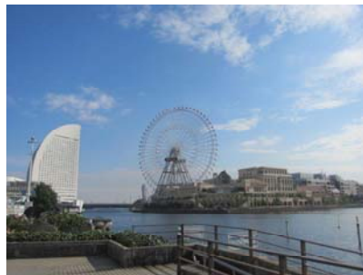
みなとみらいを歩きました