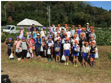
亀井小3年生と記念撮影