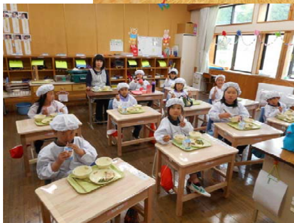
給食が始まりました