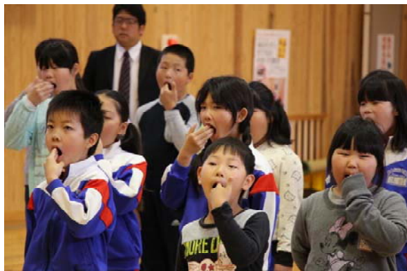
大きな口を開ける練習

4月の音楽朝会では、校歌の練習をしました。歌う姿勢や口の開け方、声の出し方等を練習しました。「ああ輝いて 輝いて生きる ぼくのわたしの萩ヶ丘小学校」と美しい歌声が木の里に響きました。