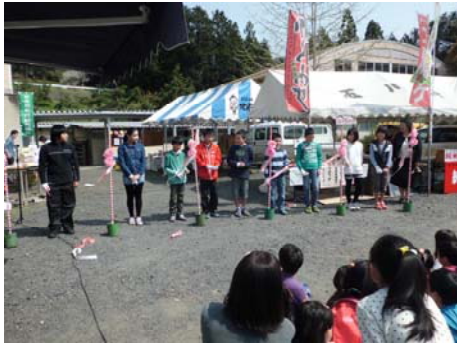
6年生が代表でテープカットをしました。

多くの皆様からの投げ銭の中から5,000円を参加費用としていただきました。この貴重なお金は、熊本地震の義援金として送らせていただきます。 担当：全教職員