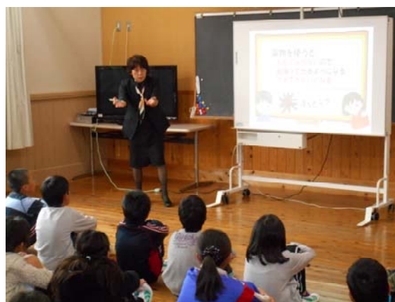
4・5・6年薬物乱用防止教室