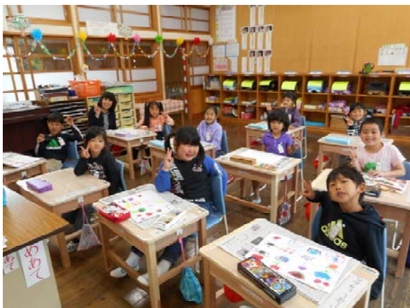
一生懸命学習に取り組んでいます