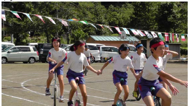
平成27年度運動会での一輪車の発表