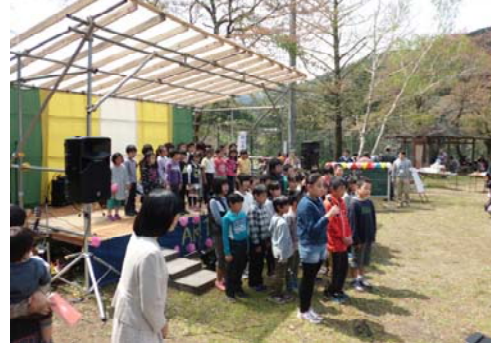
校歌や学年の歌や合奏を発表しました。